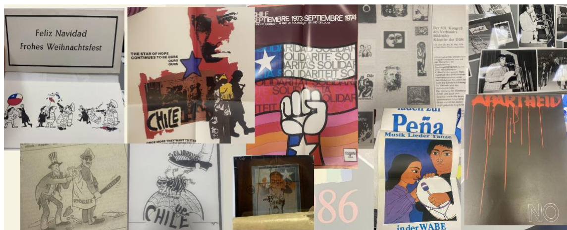
Figura 5: Imágenes de material de Colecciones diversas, Fondo Peter Stobinski.

De la misma forma, el papel de la cultura fue crucial para la resistencia y la solidaridad en la diáspora chilena. Hay varias maneras en que la cultura estuvo fuertemente ligada a la lucha contra la dictadura y a la movilización internacional. Figuras como Víctor Jara, Violeta Parra o el dueto Tiempo Nuevo, se convirtieron en símbolos poderosos de resistencia y esperanza. Sus canciones y poemas capturaron el espíritu de lucha y ofrecieron un mensaje de esperanza, influyendo tanto a chilenos como a simpatizantes internacionales. El teatro, la poesía y la música se usaron como herramientas para contar la historia de la resistencia y movilizar apoyo. Estas formas de expresión cultural permitieron a los artistas transmitir emociones y mensajes de solidaridad de manera poderosa y accesible y popularizar el arte de forma transversal entre clases y regiones en Chile y fuera del país. Artistas como el ilustrador Víctor Contreras Tapia, el poeta Sergio Macías, el ilustrador Julio Rodrigo Alegría, el xilógrafo Santos Chávez, el escritor Pablo Neruda, el director de teatro Raúl Sotelo o la cantautora Gisela May, no solo ligaron su arte esta causa, sino que también lo distribuyeron y expusieron en eventos culturales de artistas chilenos y exiliados, tanto en la RDA como en otros países. Esta fue una forma efectiva de visibilizar, internacionalizar y crear conciencia sobre la situación en Chile a través de diferentes disciplinas artísticas como armas de resistencia.