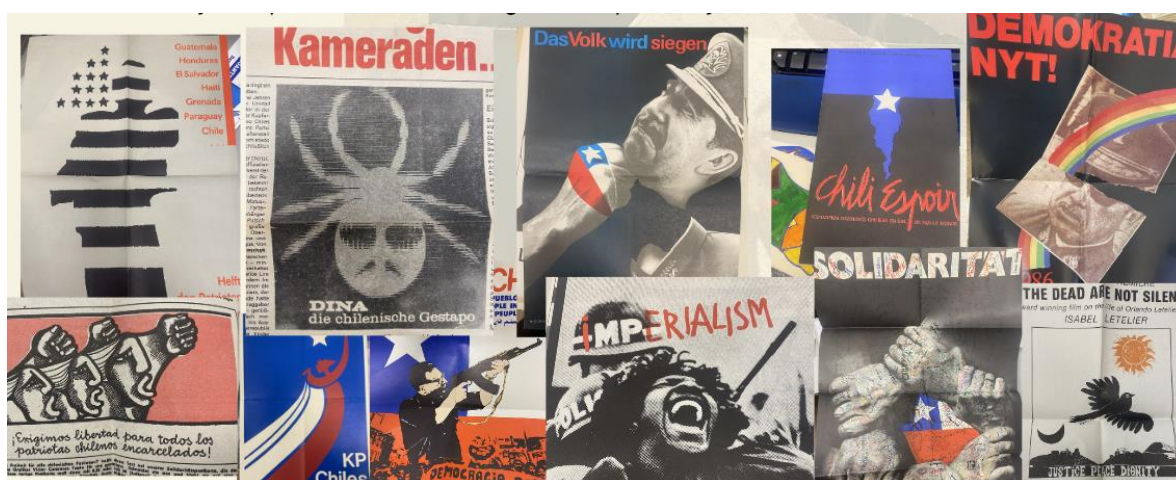
Figura 4: Imágenes de material de Colecciones diversas, Fondo Peter Stobinski.

y amigos. Así, en la diáspora, el diseño jugó un papel importante en el refuerzo de la identidad comunitaria a través de la creación de emblemas, insignias y otros elementos visuales, que fomentaban un sentido de pertenencia y solidaridad entre los chilenos en el extranjero y otros simpatizantes. Esto, a su vez, fortalecía la red de apoyo y movilización de recursos. Además, apostar por esta difusión y popularización de iconografías y diseño concretos, claros y simbólicos para comunicar sus objetivos, permitieron transmitir mensajes complejos de manera sencilla y efectiva como buena forma de comunicación de masas que facilitaba la difusión del mensaje y ayudaba a conectar con un público más amplio.