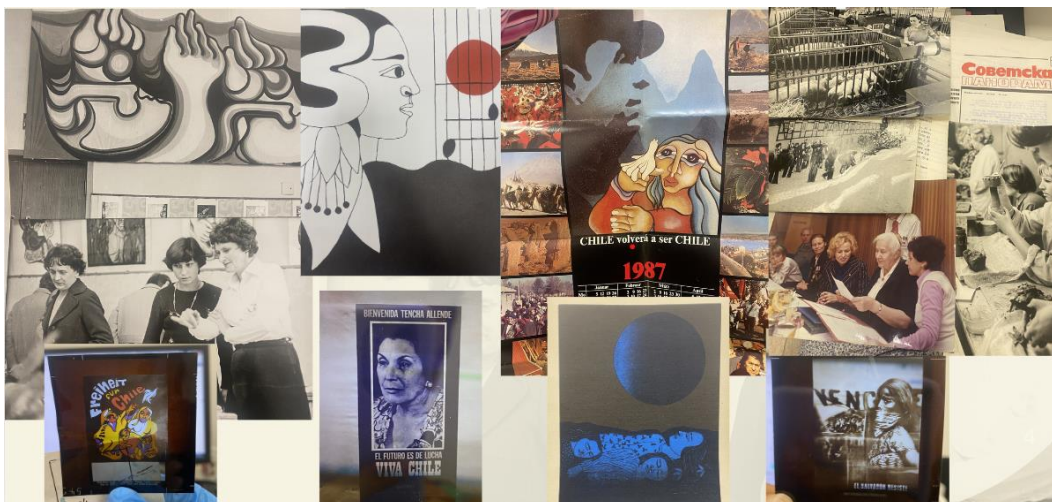
Figura 3: Imágenes de material de Colecciones diversas, Fondo Peter Stobinski.

icónica y un referente para la literatura y la cultura chilena, pues su legado inspiró a muchas mujeres en la diáspora a seguir luchando por sus derechos y libertades como símbolo de resistencia y esperanza.