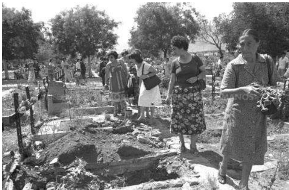
MMDH. Fondo Fundación de Documentación y Archivo de la Vicaría de la Solidaridad – Item 000469. Patio 29.