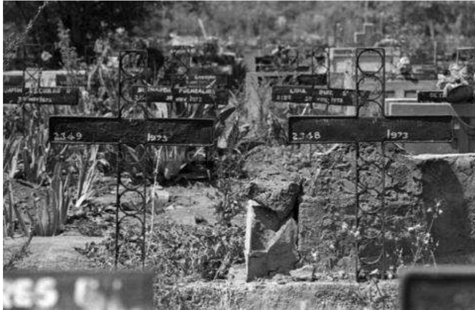
MMDH. Fondo Fundación de Documentación y Archivo de la Vicaría de la Solidaridad – Item 000472. Patio 29.