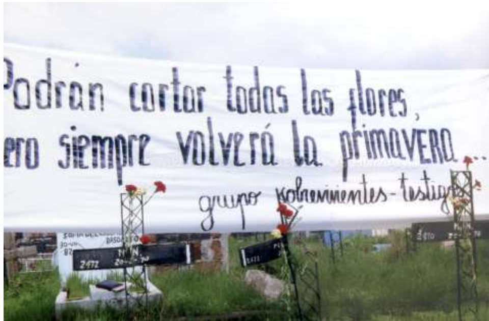
MMDH. Fondo Corporación de Promoción y Defensa de los Derechos Humanos del Pueblo – Item 000119. Patio 29.