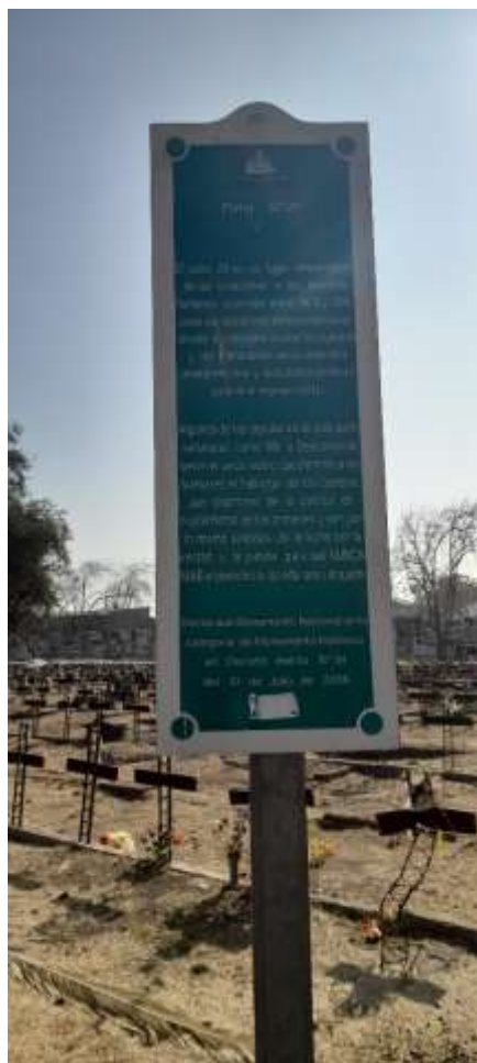
Consuelo Cofré. 20 de mayo de 2023. Señalética del "Patio N°29".