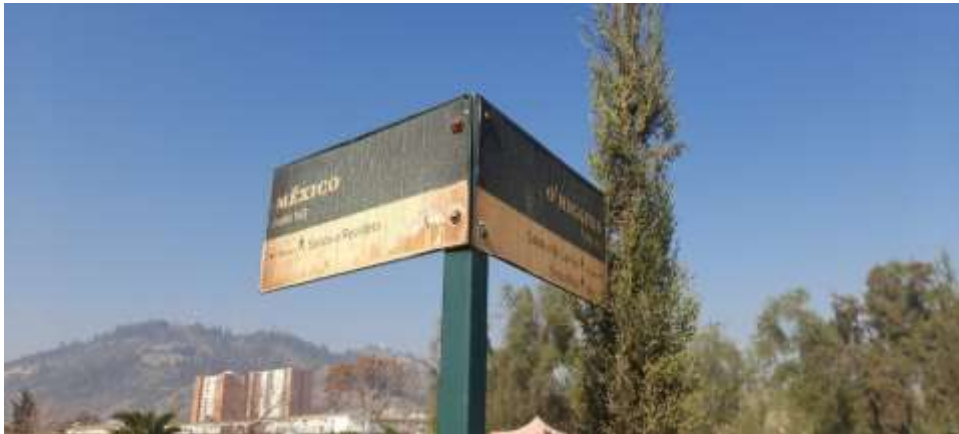
Consuelo Cofré. 20 de mayo de 2023. Señalética de las calles del Patio 29.