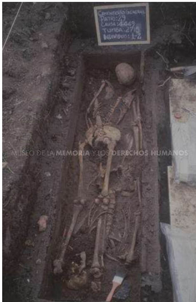
MMDH. Fondo Dauros Pantoja Marcelo – Item 000405. Osamentas.