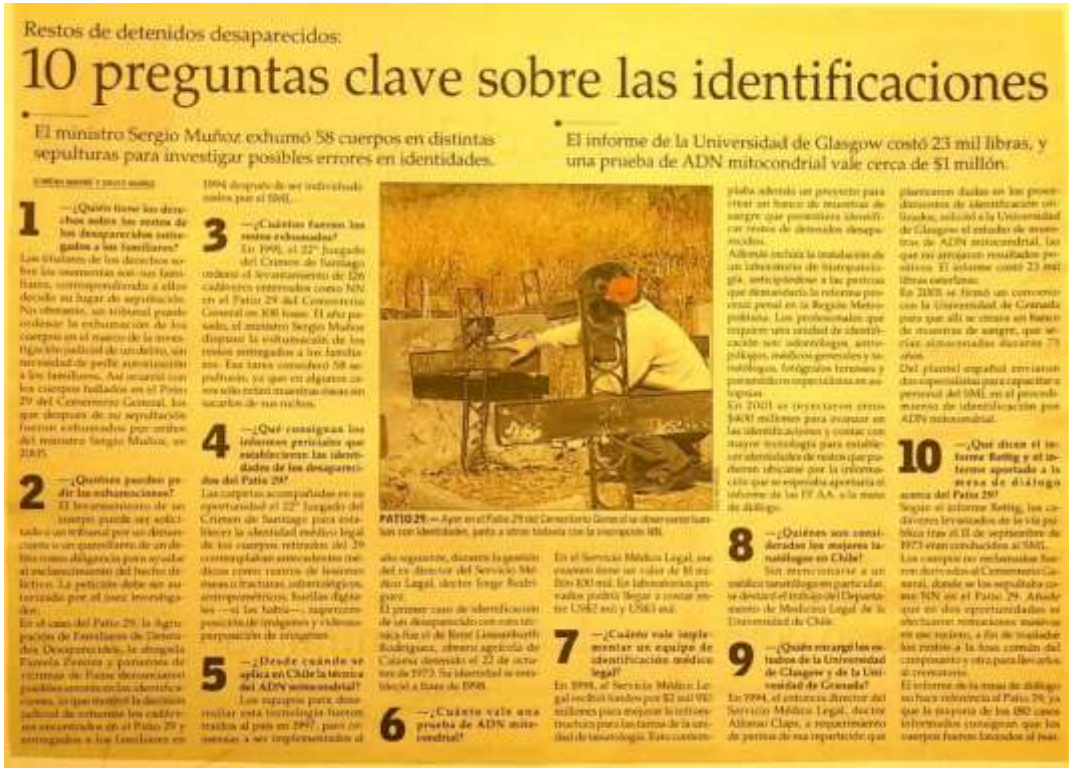
Diario El Mercurio. 2006-04-26. Restos de detenidos desaparecidos: 10 preguntas clave sobre las identificaciones.