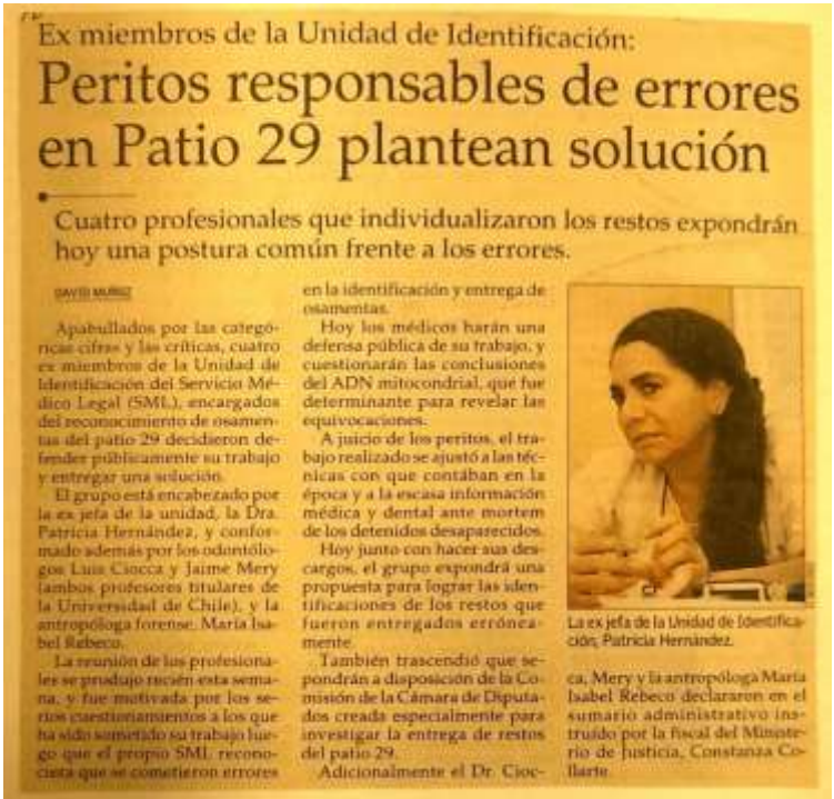
MMDH. Fondo PIDEE. Diario El Mercurio. 2006-05-05. Ex miembros de la Unidad de Identificación: Peritos responsables de errores en Patio 29 plantean solución.