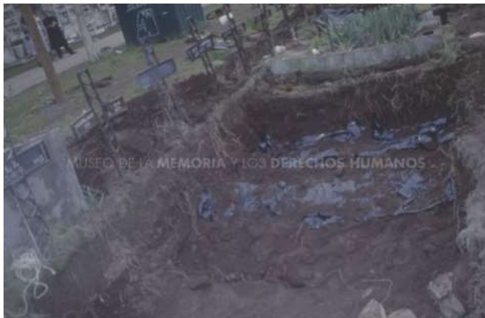
MMDH. Fondo Dauros Pantoja Marcelo – Item 000406. Patio 29.