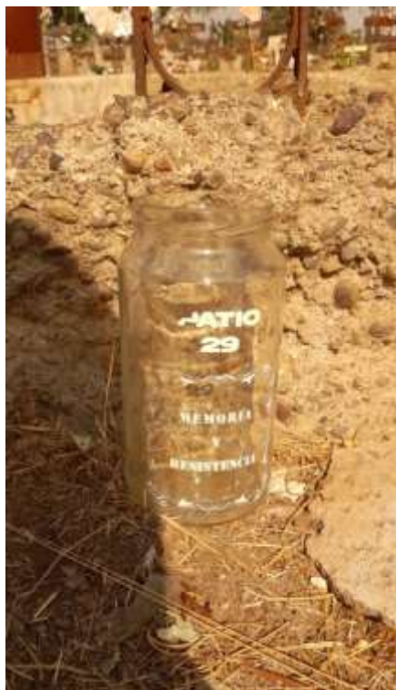
Consuelo Cofré. 20 de mayo de 2023. Intervención de los familiares al Patio 29.