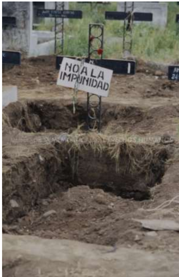
MMDH. Fondo Dauros Pantoja Marcelo – Item 000103. No a la impunidad.