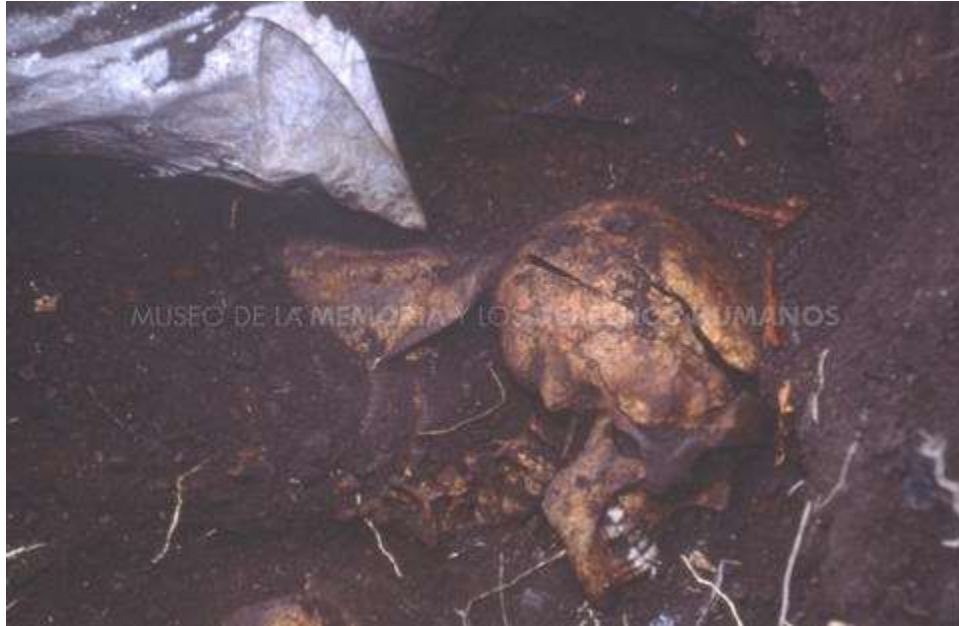
MMDH. Fondo Dauros Pantoja Marcelo – Item 000407. Osamenta.