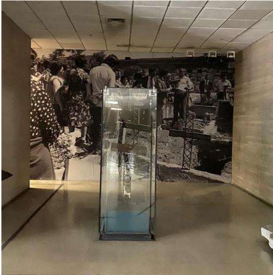
MMDH. Fondo Consejo de Monumentos Nacionales – Item 000001. Cruz del patio 29.

Esta cruz entre las colecciones del Museo representa un testimonio tangible de que en el Patio 29 se ocultaron cuerpos y las identidades de los detenidos desaparecidos y ejecutados políticos por la dictadura, como así hace referencia a la pérdida y a la búsqueda de las víctimas por medio de la frase “¿Dónde están?”. 68