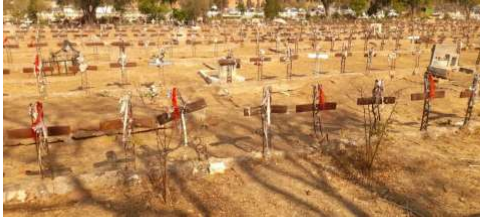
Consuelo Cofré. 20 de mayo de 2023. Patio 29.