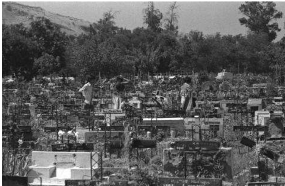
MMDH. Fondo Fundación de Documentación y Archivo de la Vicaría de la Solidaridad – Item 000477. Patio 29.