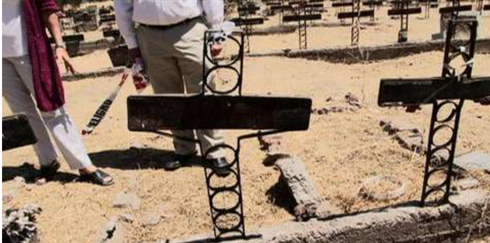
Cruz del patio 29.