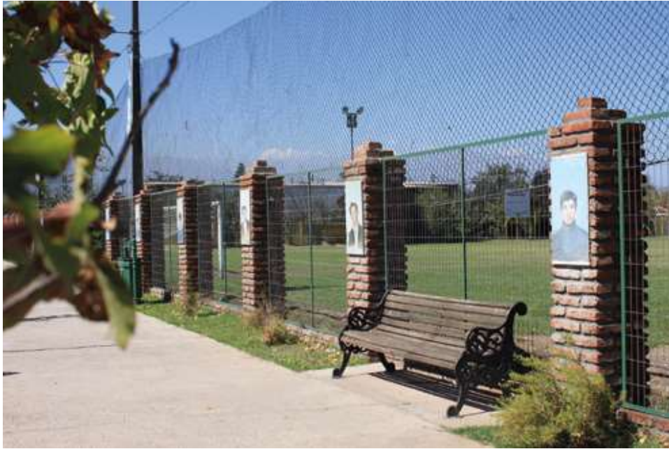
(2017). Paseo de la Memoria de Paine. Pág. 39. Memoria agrupación de familiares de detenidos desaparecidos y ejecutados de Paine. ¡¡Para que nunca más vuelva a ocurrir!!