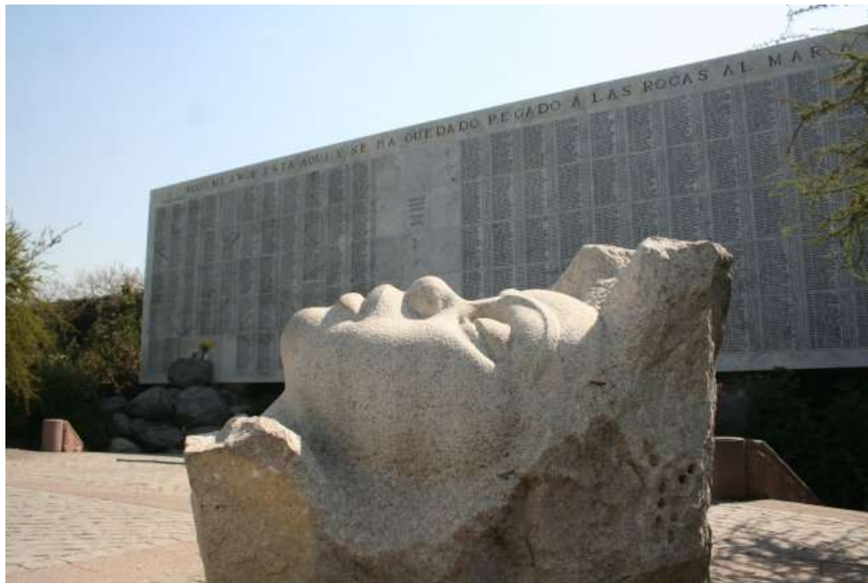
MMDH. Memorial por los detenidos desaparecidos y ejecutados políticos, en Cementerio General de Santiago.