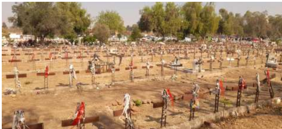
Consuelo Cofré. 20 de mayo de 2023. Patio 29.