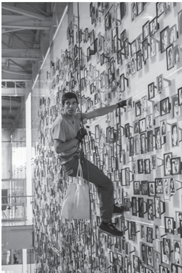
2.- Sin Título. Flickr. Web. 15 de Diciembre de 2019.