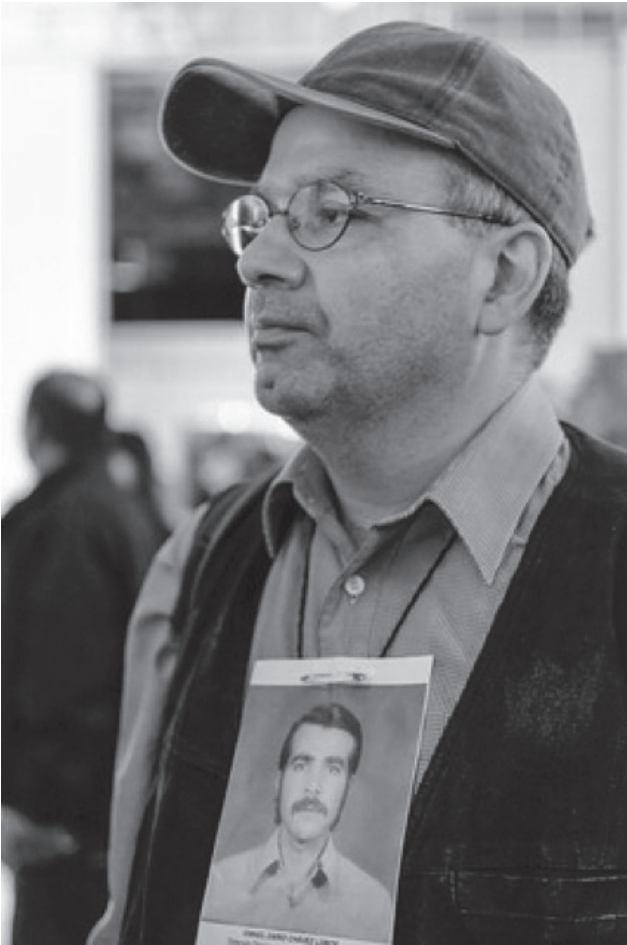
4.- Sin Título. Flickr. Web. 15 de Diciembre de 2019.