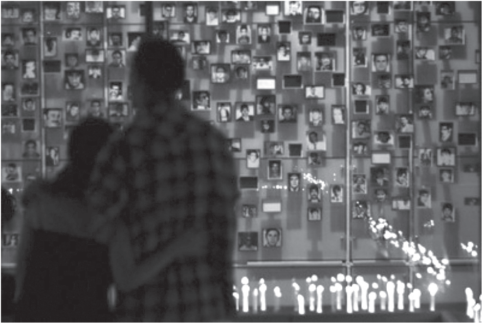
3.- Sin Título. Flickr. Web. 15 de Diciembre de 2019.