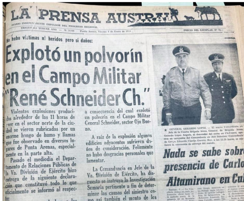
Foto 2.- La portada de La Prensa Austral da cuenta de una explosión que se ve en toda la ciudad de Punta Arenas. Se trata de un breve comunicado de prensa enviado por la V División de Ejército. Lo que no cuenta el medio es que ese día, tras la explosión, las mujeres detenidas en el regimiento de Ojo Bueno fueron trasladadas a la cárcel pública. Permanecieron todo el día y recién en la noche regresaron al recinto clandestino de detención. Nunca más en el medio se escribió del tema. Dos días antes el general, Manuel Torres de la Cruz había sido reemplazado en sus funciones.